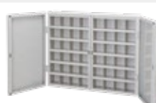
■ マイキャップボックス [48人用] TR-F-48