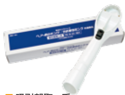
■ 吸引部取っ手 TR-H-01-001 / 1個入

吸引部取っ手への吸引マイキャップの取り付け・取り外しは、左図のように行なってください。無理やり取り付け・取り外しを行なうと損傷するおそれがあります。コンタクトレンズを使用の人は、そのまま(付けたまま)使用しても取れることはありません。万が一取れた場合、吸引マイキャップの底面(メッシュ部)で止まります。