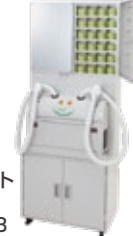
■ 設置台セット [2人用] TR-FW-48