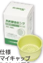
■ 抗菌仕様 吸引マイキャップ TR-F-01 / 4個入