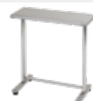
■ 床置用置台[2人用] HW-TRC用 / 1台