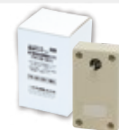
■ 完了信号出力回路ボックス TR-05-001 / 1個

●この製品は日本国内用ですので日本国外では使用できません。また、日本国外でのアフターサービスも受けられません。●製品、および付属品の改造は、絶対にしないでください。