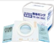
■ 取替用集塵袋 TR-04-002 / 5枚入