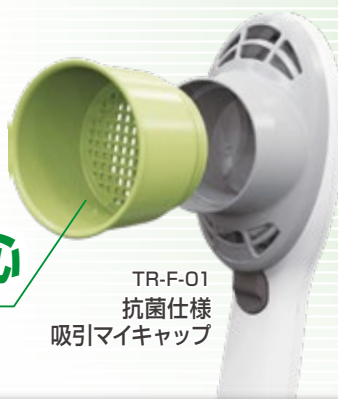
TR-F-01 抗菌仕様 吸引マイキャップ