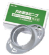
■ 吸引マイキャップベース TR-F-B / 1個入