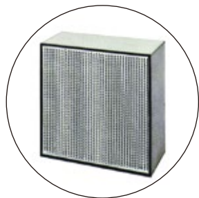
中性能フィルター